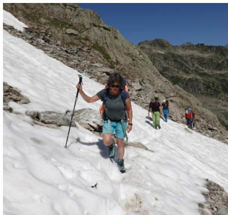
Leiterfortbildung Hochtouren