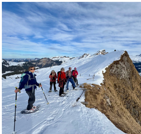
Schneeschuhtour aufs Lauchernstöckli