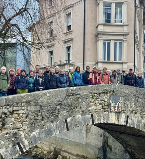
Adventswanderung der Werktagswander:innen, Foto zVg.