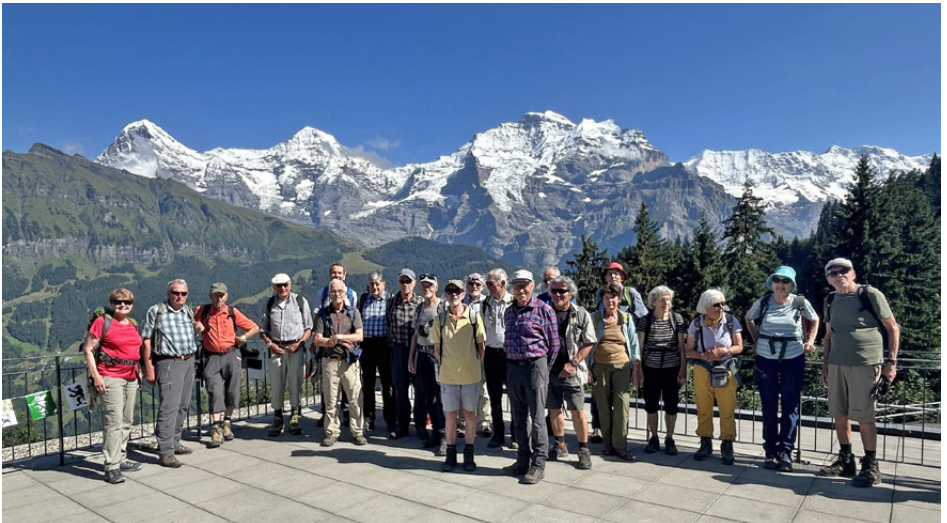
So macht Wandern Spass! Die Veteranen auf der Grütschalp vor dem herrlichen Panorama von Eiger, Mönch und Jungfrau.