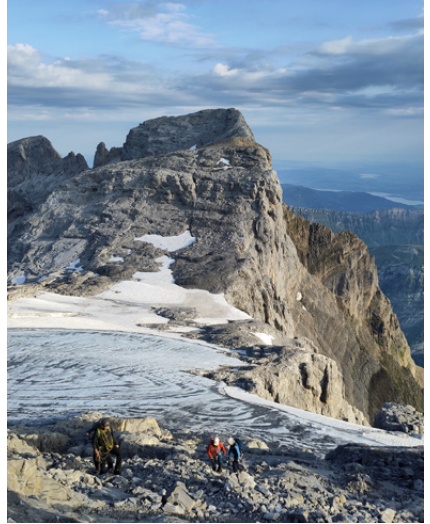
Sommerhohtour aufs Vrenelisgättli, Foto: Maurizio Ceraldi