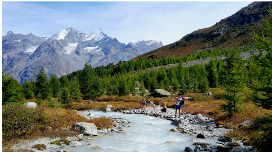
Wird zunehmend beliebter: Der Abenteuerzstieg zur Weisshornhütte