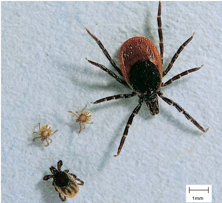
Abbildung 1: Ixodes ricinus (Holzbock): Zeckenstadien