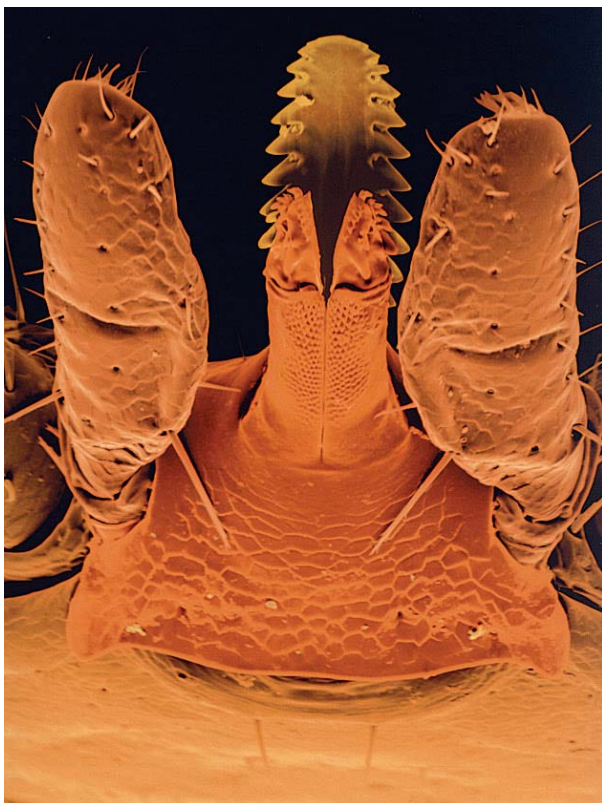
Abbildung 2: Stechapparat (Rostrum) der Zecke