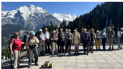
Veteranen auf der Grütschalp

Die meisten werden diesem Beatles-Song irgendwann begegnet sein. Ich knüpfe an: Ob wir es wahrhaben wollen oder nicht: Es ist eine unumstössliche Tatsache, dass wir alle jedes Jahr um zwölf Monate altern. Dafür gibt es in unserer Sektion seit mehr als 60 Jahren die bewährte, vielseitige, partnerschaftliche Veteranen-Vereinigung.