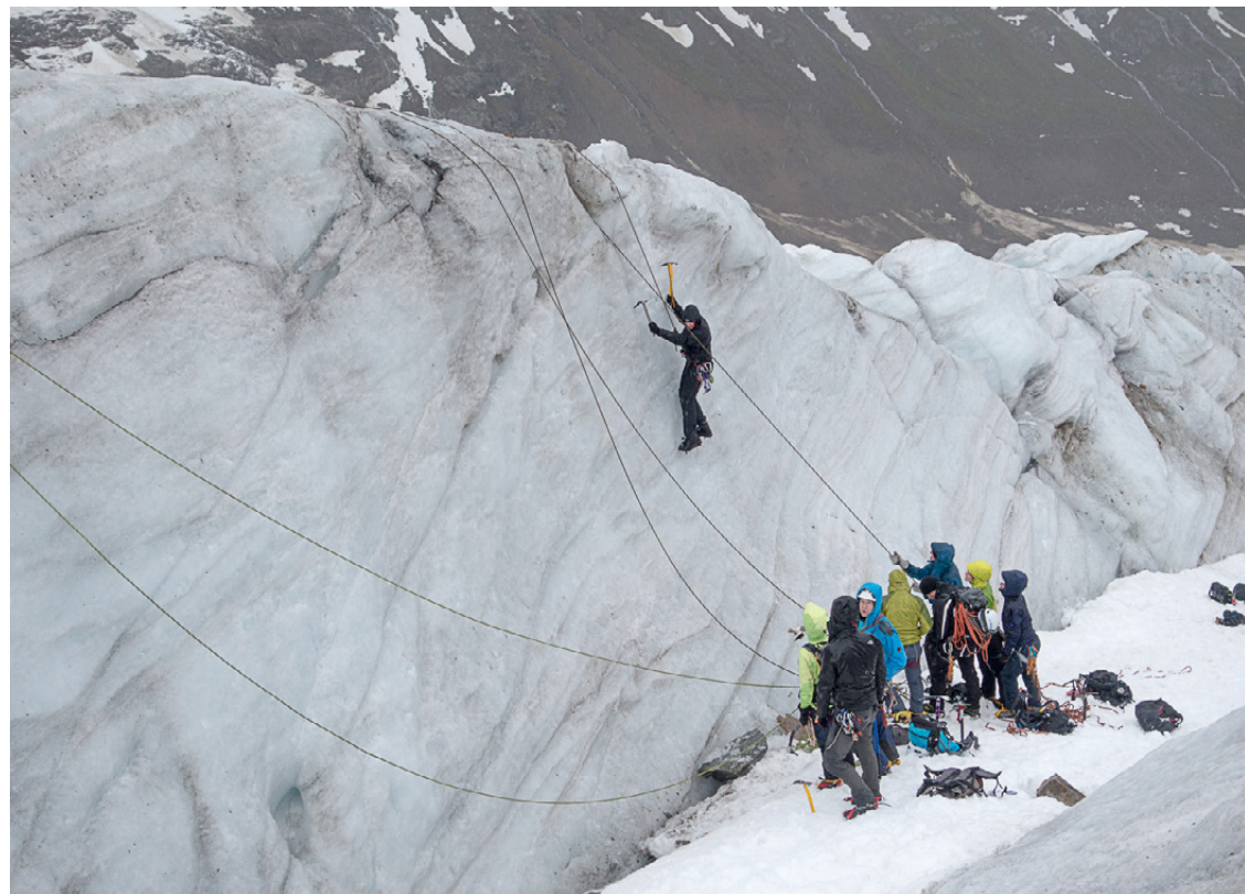
Eiskurs am Anen-Gletscher.