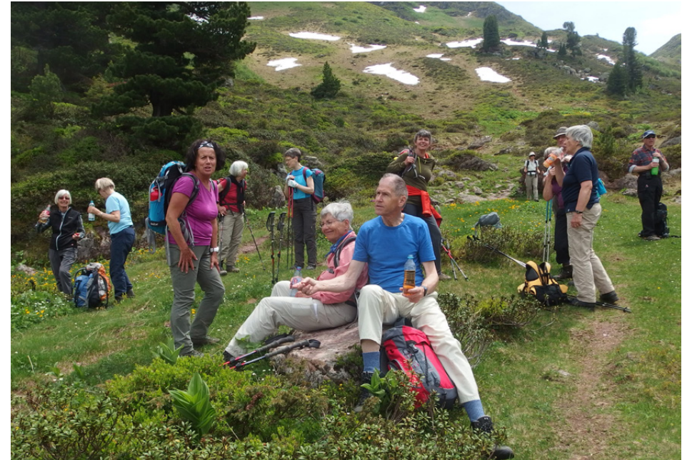
Foto: Abstieg von den Murgseen