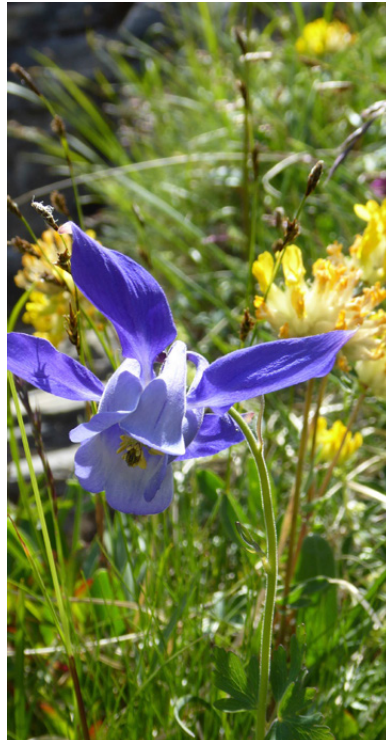
Eine Alpen-Akelei, dahinter der Echte Wundklee.