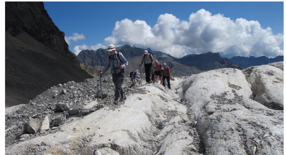
Sommertour Sanetsch – Scex Rouge.